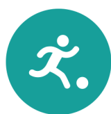
Spel en beweging/ bewegingsonderwijs